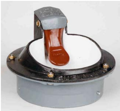
Type 41 A Tuoteno. 4120141

Dan Egtved Agro-teknik valikoimaan kuuluu useita erillaisia lämmitettäviä juomakuppeja. Lämmitettäviä juomakuppeja on uimurilla, läppäventtiilillä ja putkiventtiilillä toimivia. Juomakuppien runko on valmistettu vahvasta valuraudasta ja lämmitysvastus on sijoitettu välipohjaan. Käytettävä vastus on 24 volt / 80 W. Muuntajaan voi kytkeä useita kuppeja muuntajan koon mukaisesti.