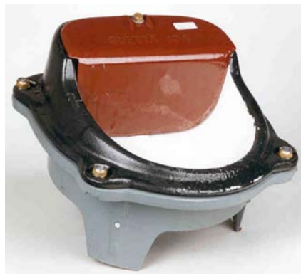
Type 43 A Tuoteno. 4120143