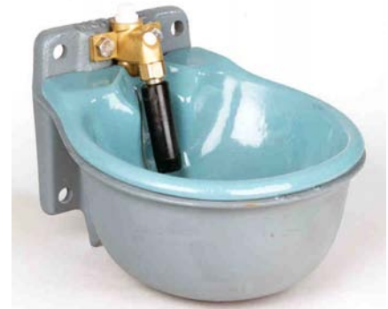
Type 46 Tuoteno. 4120146.

Type 41 A ja Type 43 A asennetaan betoni tms. putken päähän. Putken syvyys on oltava alle ruotarajan ja paljaana oleva yläosa putkea eristettään sisäpuolelta.